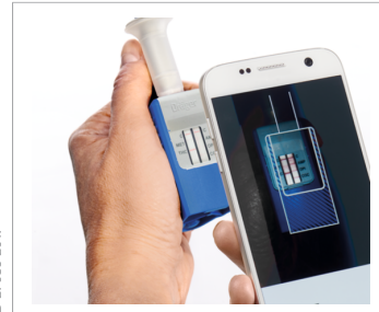
6. Noch effizienter Drogen detektieren: Mit der Dräger DrugCheck® App