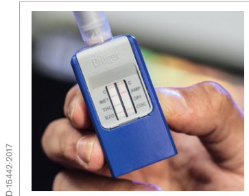
5. Testergebnisse ablesen