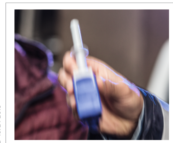
2. Einstecken des Probennehmers in die trichterförmige Öffnung