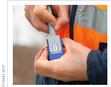
4. Testauswertung starten